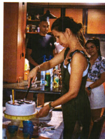
2023. 08. 26. Biró Alapítvány 7. születésnap