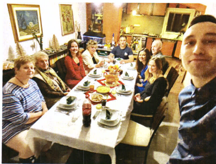
2023.12.19. Közös Karácsony